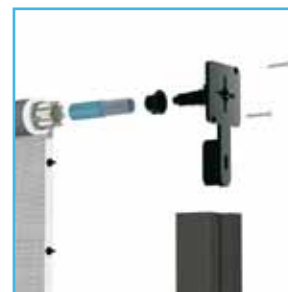
freno rallentatore per molla