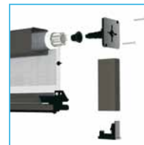
guida 17 x 35 mm modello Ferrara